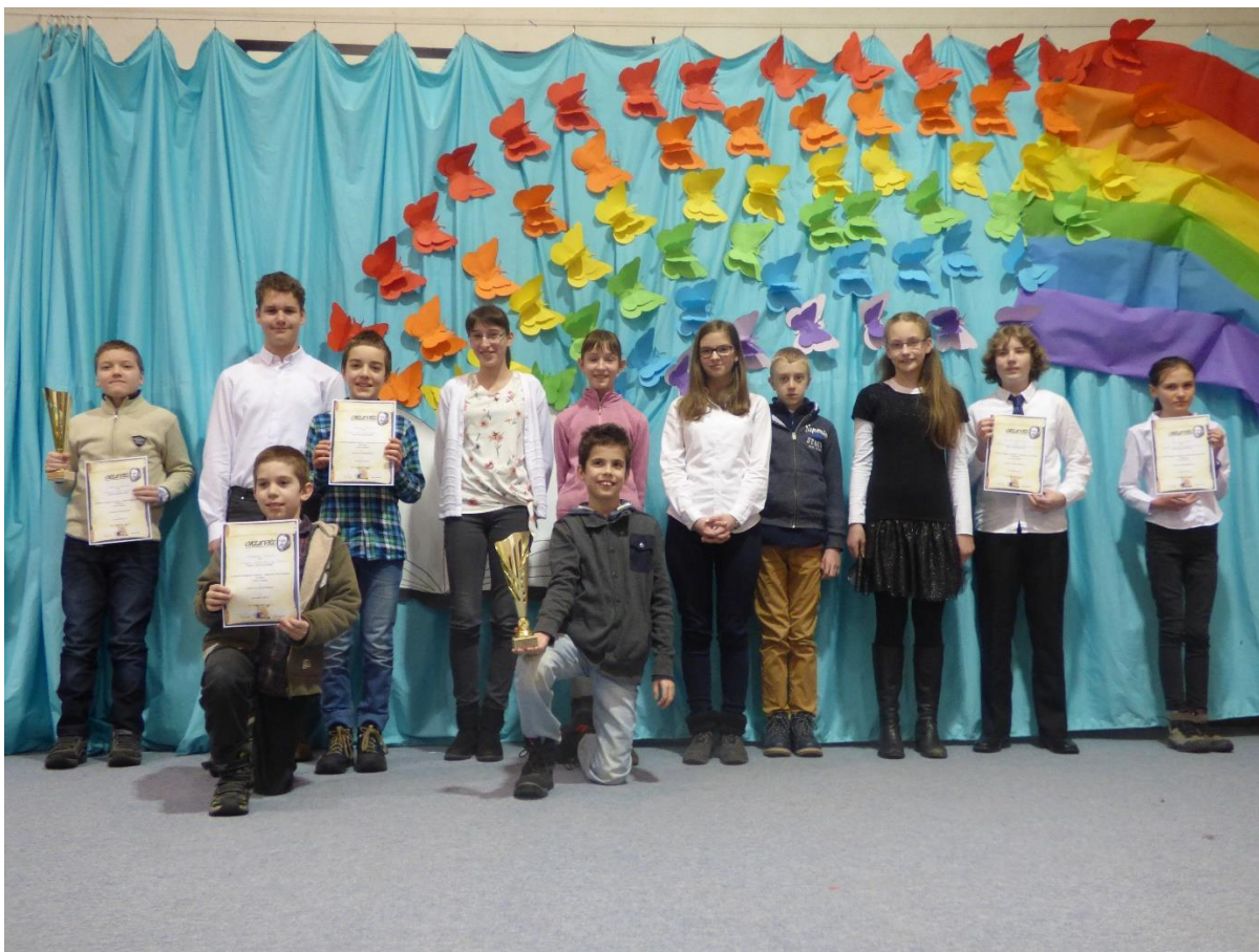
Dobogós helyezést elért tanulók