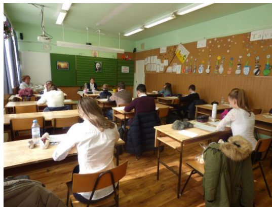
A tollbamondást a feladatlap kitöltése követte

A nap egyik legjobban várt eseménye – természetesen – az eredményhirdetés volt. A záró eseményre ellátogattak iskolánkba Dunai Mónika országgyűlési képviselő is. Beszédében